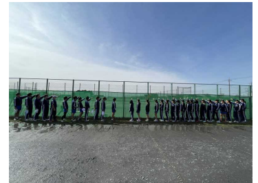
【男女ソフトテニス部】