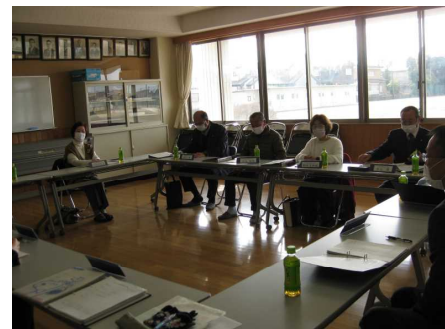
▲会議の様子（第3回目）