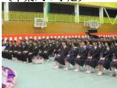
〔昨年度の卒業式風景〕

いよいよ卒業式の準備の時期が来ました。今年は3月9日(土)に実施の予定で計画が進められています。今年は例年とは違い、初めて都賀文化会館ハートホールをお借りして実施しようとしています。立派な施設に隣接している中学校の利点をフルに生かそうとしての試みです。思い出に残る感動的な卒業式になることを願っています。