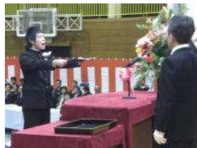
〔昨年度の卒業式風景〕

いよいよ卒業式の準備の時期が来ました。今年は3月9日(土)に実施の予定で計画が進められています。今年は例年とは違い、初めて都賀文化会館ハートホールをお借りして実施しようとしています。立派な施設に隣接している中学校の利点をフルに生かそうとしての試みです。思い出に残る感動的な卒業式になることを願っています。