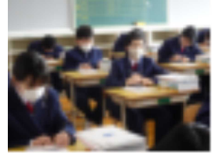
【クラス発表 何組かな?】