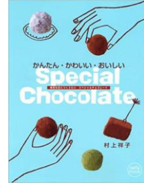
☆スペシャルチョコレート