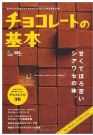
☆チョコレートの基本