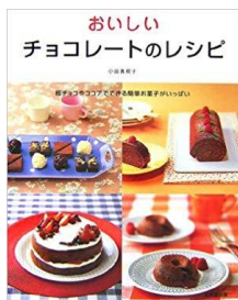
☆おいしいチョコレートのレシピ