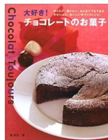
★大好きチョコレートのお菓子