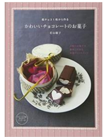
☆板チョコ1枚から作る かわいいチョコレートのお菓子 その他