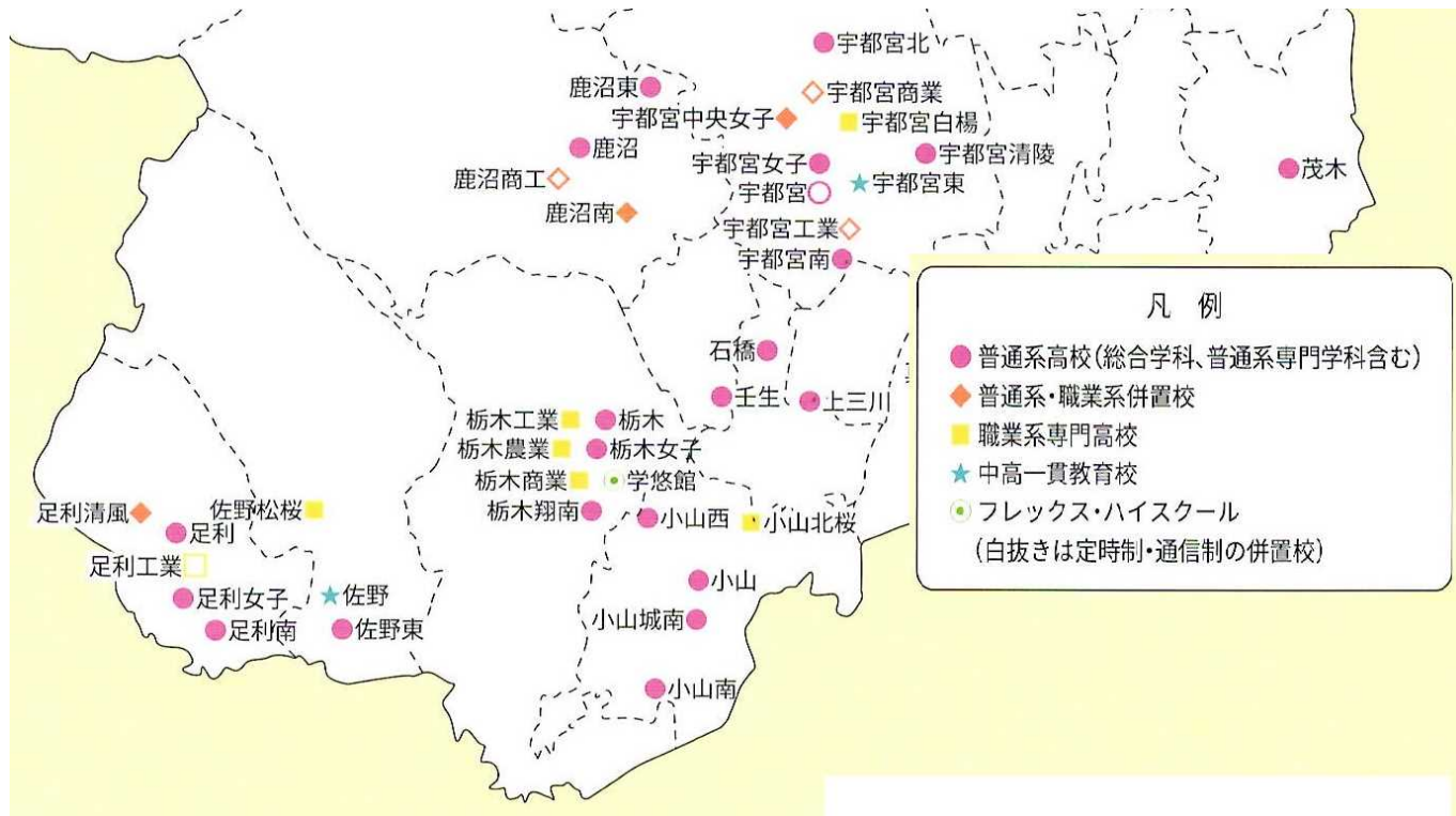
とちぎの県立高校ガイド2020（栃木県教育委員会）より抜粋

すべての高校ではありませんが、本校の生徒がこれまでに進学することが多い、県内の県央部と県南部の高校のおおよそのマップとなります。ここに載っている高校が、すべて通いやすいかどうかは、個人の判断ですが、栃木南中学区には、【栃木駅】があり、東武線、JR線（両毛線）が通っていることで、宇都宮方面、小山方面、足利・佐野方面、鹿沼方面と、多方面を進学先の候補として考えることができると思います。