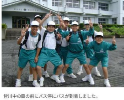
菅川中の目の前にバス停にバスが到着しました。