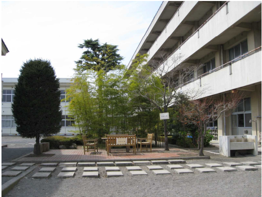
＜竹庭園と東筈広場＞