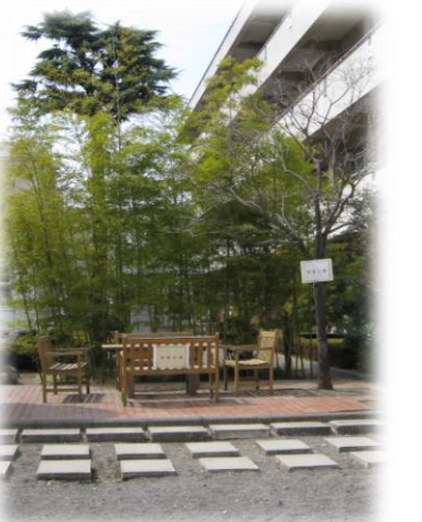
＜竹庭園・東筍広場＞