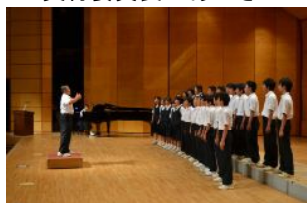
第2学年優秀賞 2年3組