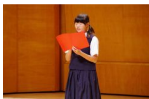
実行委員長 あいさつ