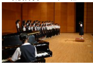
第1学年優秀賞 1年3組

どのクラスも、一生懸命に歌い、一生懸命に聴く。 一生懸命には、一生懸命で応える。私は、東中の「伝統」が、着実に受け継がれていることに感動しました。