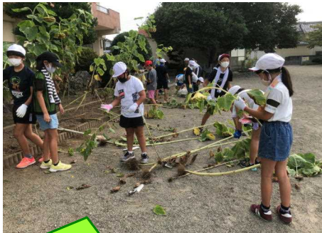
ひまわりの茎が太くて、切るのが大変だったよ！

9月26日(土)には、リサイクル活動 が行われます。例年2回実施していますが、今年度は、臨時休業期間だったため5月には実施できなかったため、今回1回のみでの開催となります。引き続き、ご協力をお願いいたします。