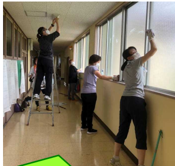
体育館の窓や床、廊下や教室の蛍光管や窓のさん、トイレもピカピカになりました！