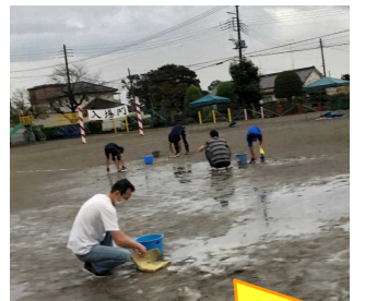
早朝の大雨でできた校庭の水取り作業にもお手伝いいただき、ありがとうございました。

転んでも起き上がってゴールを目指す姿、一杯杯友達を応援する姿、雨の中あきらめずにバトンをつなぐ姿、係の仕事に責任をもって取り組む姿…子どもたちの「いいところ」がたくさん見つかりました。順位や勝敗にかかわらず、精一杯自分の“よさ”を発揮する子どもたちの姿に、胸が熱くなりました。子どもたちを、学校を、支えてくださっているご家族の皆様に、たくさん感謝する行事となりました。“密”を避け、人と人との間隔をあけての活動でしたが、 人と人との心の結びつき を実感し、とても温かい気持ちになり、改めて「大宮南小学校」が大好きになりました。本当にありがとうございました。