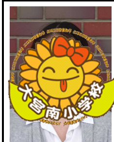
スクールカウンセラー

今年度、大平東小・大平南小から異動してまいりました。大宮南小で英語の先生として働くことを楽しみにしています。いっしょに、英語を楽しく勉強しましょう!!私は、チョコレートと寿司が好きです。クラフトと絵を描くことが得意です。いつも、頑張りたいです!