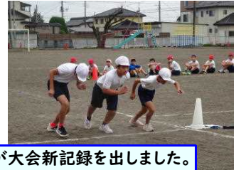
高学年ロングコースで、5年生男子が大会新記録を出しました。