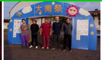
ひまわりコンテストの表彰