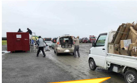
アルミ缶、エコキャップ、段ボール、雑誌・その他の紙類、新聞紙を、それぞれのトラックやコンテナを回っていただきました。積みおろしの仕事も、お世話になりました。