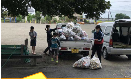
各地区の回収前に、学校に保管していた資源物を運ぶお手伝いもしていただきました。

「アルミ缶」と「エコキャップ」については、毎月児童による回収もしておりますので、今後もどうぞご協力ください。よろしくお願ひいたします。