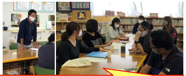
リサイクル活動終了後、PTA本部役員会を図書室で行いました。諸行事の反省と次年度の役員選出について等を協議していただきました。