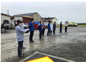
今年度は、PTA総会が紙上決済だったため、なかなか機会がつかなかったため、最後に「職員紹介」をしました。