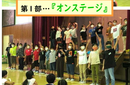
第1部…『オンステージ』