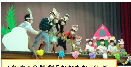
1年生：音読劇「おおきな かぶ」

大南小の願いでもある子どもたちの『ひまわり』のような笑顔があふれ、小規模校である本校の子どもたちの“いいところ”を感じていただけたのではないかと思います。