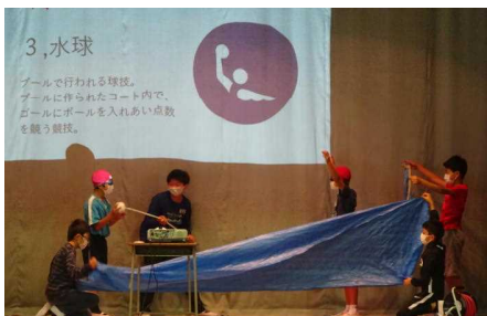
6年生：オリンピック・パラリンピックで学んだこと…「ピクトグラム」クイズ