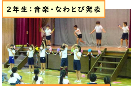
2年生：音楽・なわとび発表