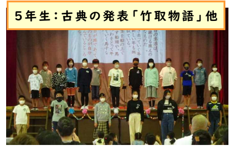
5年生：古典の発表「竹取物語」他