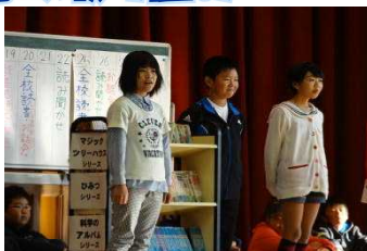
上は図書委員会の発表

委員会発表の時間に、図書委員会の日頃の活動報告や図書館利用の仕方について全校生へのお願いがありました。読書旬間の取り組みや読み聞かせの本紹介もありました。