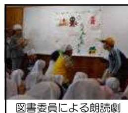
図書委員による朗読劇

10月9日～19日は、校内読 書旬間です。おすすめの本の紹 介や感想画・感想文の募集、校 内放送や「りんごの会」による 読み聞かせ、図書委員会による 朗読劇などが行われました。読書の秋真っ盛り、良書と たくさん出会い、頭も心も豊かにしてほしいと思います。