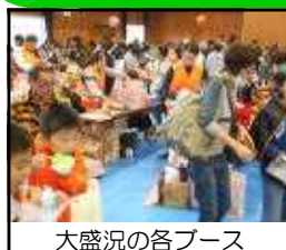
大盛況の各ブース

10月13日(土)、毎年恒例「P TAハロウィンバザー」が盛大 に行われました。役員さん中 心の素敵な企画に、子どもた ちも思い思いの衣装に身を包 み、楽しく参加しました。西 中吹奏楽部の皆さんにも御出演願 い、華を添えていただきま した。綿あめや焼きそば、ゲームコーナーやプラ板 作り、抽選会など、会場は大いに盛り上がりました。ま た、今年は校庭に大きな「とち 介ふわふわハウス」も登場し、 大人気。大勢の方にお世話にな り、大成功を収めることができ ました。御協力いただいた皆様、 ありがとうございました。