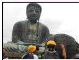
大仏様、頭が良くなりますように!

10月4日か ら5日にかけて、6年生が修学旅行に行っ てきました。1日目は鎌倉の班別 自由行動。自分たちの計画に 従い、友達と一緒に鎌倉の歴 史や自然と触れ合ってきました。