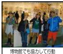
博物館でも協力して行動

したが、こちらも上手に時間を 調整し、臨機応変に対応するこ とができました。この2日間で の学びを、今後の生活にぜひ生 かしてほしいと思います。