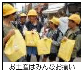
お土産はみんなお揃い

特に立派だったのは、みんなが 互いを思いやり協力する姿、早 め早めに行動し時間を守る態度 など、本校の最高学年としての 自覚をもって行動できたところ です。2日目は国会議事堂見学 と国立科学博物館での班別行動