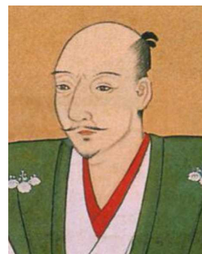
織田 信 長

保護者の皆様、地域の皆様、関係各機関の皆様には、日頃より子どもたちのために御尽力いただき、たいへんありがとうございます。今後とも、本校の教育活動に対しましての温かい御支援・御協力をよろしくお願いいたします。