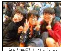
みんなも仮装してLet's go

10月13日(土)、毎年恒例「P TAハロウィンバザー」が盛大 に行われました。役員さん中 心の素敵な企画に、子どもた ちも思い思いの衣装に身を包 み、楽しく参加しました。西 中吹奏楽部の皆さんにも御出演願 い、華を添えていただきま した。綿あめや焼きそば、ゲームコーナーやプラ板 作り、抽選会など、会場は大いに盛り上がりました。ま た、今年は校庭に大きな「とち 介ふわふわハウス」も登場し、 大人気。大勢の方にお世話にな り、大成功を収めることができ ました。御協力いただいた皆様、 ありがとうございました。