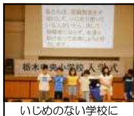
いじめのない学校に

に取り組む決意を新たにしま した。また、9月に実施された 「あったか栃木いじめ防止子 どもフォーラム」の宣言文も 読み上げられ、いじめのない 学校づくりについても確認し 合いました。