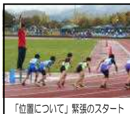
「位置について」緊張のスタート

歓会が、10月12日(金)に市陸 上競技場で開催され、本校から も大勢の選手が出場しました。 朝に夕にとこれまで練習してき た成果を十分発揮し、今ある力 を精一杯出し尽くして頑張しま した。これまでの努力は、全員