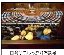
国会でもしっかり勉強

です。国会議事堂では、要人 の到着を待つのにかなり待た されてしまいましたが、特に 慌てることもなく、節度をも って行動しました。その分博 物館での時間が短くなってし まいま