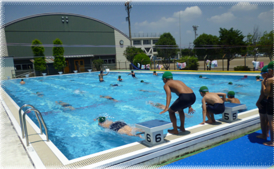
【5年生の水泳の授業「平泳ぎ」を練習中の子どもたち】

プールが青、プールサイドも青、おまけに空まで真っ青という7月2日。プールサイドの気温は35℃を越えていましたが、子どもたちは歓声を上げながらプールの中で水しぶきを上げていました。