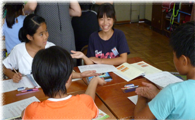
【4人のグループとなって「意見交流」する5年生児童】

子どもたちの学力を伸ばすための取組は、学校の最も重要な教育施策となっています。栃三小では、今年度、「学び合いを生かした確かな学力の育成」という研究主題を掲げ、学校全体で授業研究会を行って、子どもたちの学力の向上を目指して取り組んでいます。