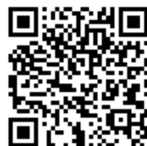
三小のホームページのQRコードです。

週1回程度、「今日の2年生」という題でホームページを更新しております。学習風景を中心に載せておりますので、ぜひ、御覧ください。