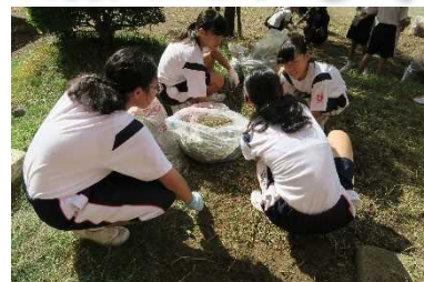
奉仕作業ですっかりきれいになりました！

運動会練習へのご協力ありがとうございます。また、先日のPTA奉仕作業では、暑い中除草作業をしていただき、大変お世話になりました。2学期は9月に運動会、10月に西中祭、11月に校内駅伝大会と大きな行事が続きます。行事を通してクラスの絆を深め、生徒の成長が見られるような学期にしていきたいと思えます。