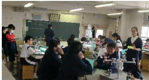
3組「光合成に必要なものは？」