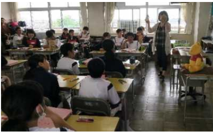
1組「This is a present for you！」

お忙しい中、学校へ足を運んでいただきありがとうございました。授業参観でご覧いただいたとおり、生徒達は元気に明るく、授業にも前向きに取り組んでいます。今後ご家庭との連携を密にしながら子ども達の成長を支えていきたいと考えております。よろしくをお願いいたします。