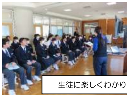
生徒に楽しくわかりやすく話しました

4月9日（水）は、年度初めのオリエンテーションを行いました。2、3 時間目に全校集会で各担当の先生方から本校の学習、生活、交通、清掃、給食についての話を聞きました。1 年生にとっては、中学校生活の見通しをもつことができたと思います。2、3 年生にとってもその意義や内容を再確認する機会となったと思います。少し長い時間となりましたが、楽しくわかりやすく話してくれた先生方、そして先生方の話を集中して聴いている生徒たちがとても素敵でした。