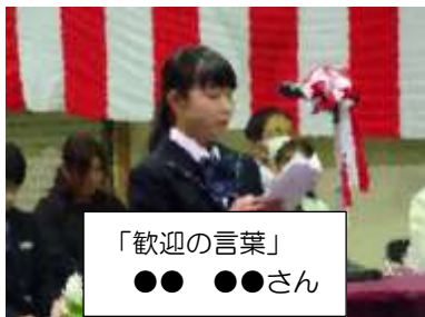
「歓迎の言葉」 ●● ●●さん

と伝統ある寺中生としての意気込みが感じられ、頼もしく感じました。式の後には全校生徒、教職員、新入生の保護者、PTA 役員の皆様、参列者全員で、校庭の桜をバックに笑顔で記念撮影をしました。令和 7 年度『寺中丸』の出航です。一致団結、いざ大海原へ。