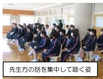
先生方の話を集中して聴く姿