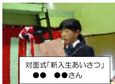
対面式「新入生あいさつ」 ●● ●●さん