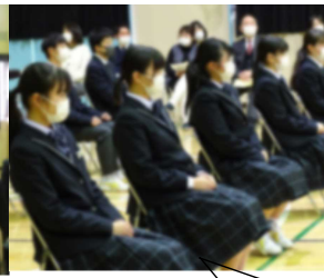
後輩たちの歌をしみりと聴く3年生