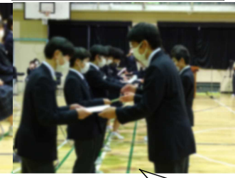
後輩たちから色紙のプレゼント