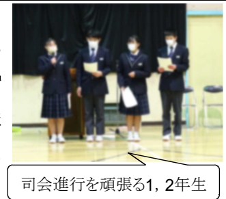
司会進行を頑張る1,2年生

2月24日(金)に行われた3年生を送る会は、新生徒会役員が主催する初めての大きな行事でしたが、1,2年生の「お世話になった3年生へ、感謝の気持ちを伝えたい」という思いの詰まった、寺尾ならではの心温まる素晴らしい会になりました。1,2年生からは、「伝統のバトン」を3年生から引き継ぎ、4月からはそれぞれ「先輩」「最上級生」になる自覚が伝わって来ました。3年生にとっても、いよいよ卒業が近づいてきたことを実感する時間になったと思います。