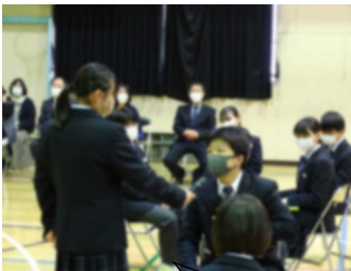
3年生にインタビュー