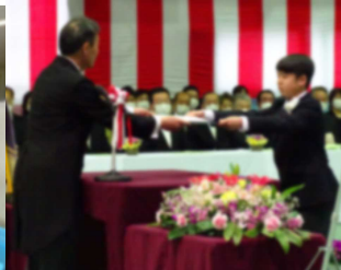
卒業証書授与。会場に響き渡る大きな返事が立派でした。