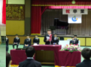
感動的だった卒業生代表の●●●さんによる答辞