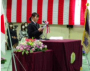
先輩への感謝の思いが詰まった●●●さんの送辞