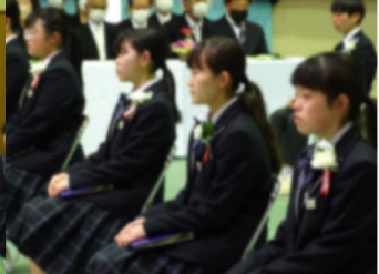
校長式辞を真剣に聴く卒業生