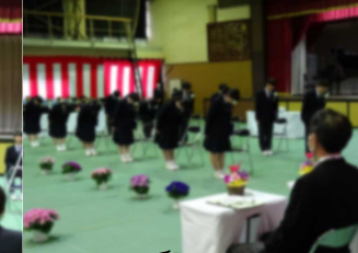
退場前に職員席に一礼する卒業生