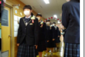
雨のため室内での見送りでしたが、みんなで卒業生を祝福しました。