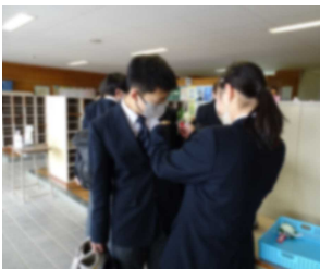
登校時にコサージュを付けてもらう卒業生

3月13日(月)、栃木市立寺尾中学校第76回卒業式を挙行了いたしました。多くのご来賓及び保護者の皆様にご参列いただき、本校らしい温かくて感動的な卒業式になりました。令和2年4月、臨時休業の合い間を縫って行われた入学式から早3年。「コロナ禍」においても、決して不平不満を言ったり投げやりになったりすることなく、常に素直で前向きに学校生活を送ってきた卒業生の皆さんの姿勢は大変素晴らしく、本校の誇りです。そんな皆さんの前途には、洋々たる未来が広がっていることと信じています。この先、どんな困難にぶつかっても、中学時代の素直さと前向きさを忘れることなく、76年の歴史と伝統に輝く寺尾中学校の卒業生であることに自信と誇りを持って、未来へ向かって大きく羽ばたいてほしいです。卒業生の皆さんが、先輩から受け継ぎ、つないでくれた本校の「伝統のバトン」は、1, 2年生が確かに引き継ぎます。