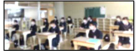
式前の学活 真剣に話を聞いていました

あたたかい春の日ざしに包まれ、無事に令和4年度入学式を行うことができました。保護者の皆さまには、入学式へのご参列、保護者オリエンテーションへのご参加、ありがとうございました。