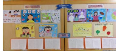
寺尾小 給食週間ポスターと作文

※児童生徒のみなさんが書いた、給食週間の作文や標語の中から優秀作品を2月と3月でご紹介したいと思います。裏面をご覧ください。