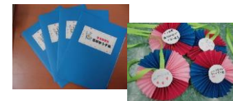
給食委員が作った