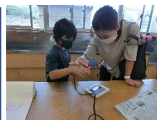
▲オープンスクール