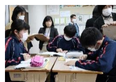
▲小中合同の授業研究