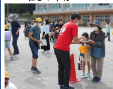
▲小中合同引き渡し訓練