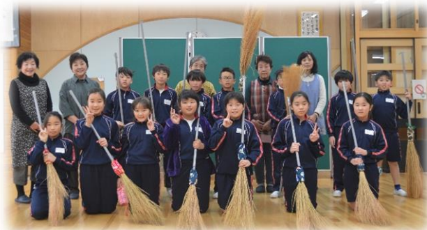
↑ コキアのほうき作り 年末の大掃除はぼくたちに任せてね