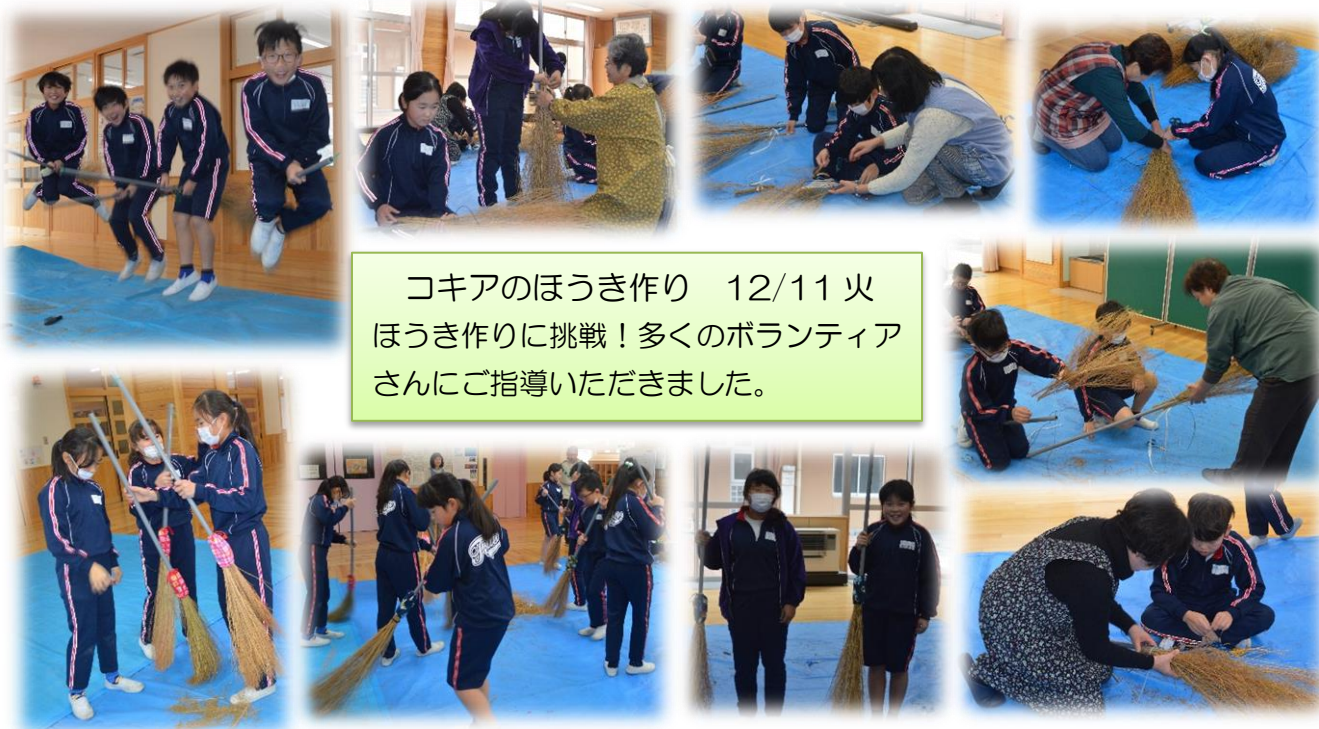
コキアのほうき作り 12/11 火 ほうき作りに挑戦!多くのボランティア さんにご指導いただきました。