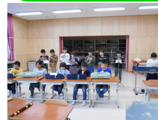
合奏が上手になりました♡

3学期から3年生もおはやしの練習に参加します。6本調子の篠笛を使用します。家にご家族の使用した物がありましたら、どうぞ、そちらを使ってください。学校で購入する場合は、後日、詳細を記入したプリントを配布しますので、そのときに集金いたします。（授業参観の際に見本を掲示します。）大切に扱うために、横笛が届いたら、袋をご用意ください。