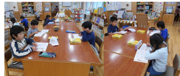
辞書引きコンクール がんばったね!