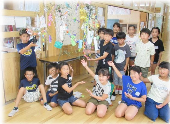
↑七夕に願いを込めて ☆素敵な夏休みになりますように☆

そして、家族や友達、地域の人、自然とふれあう中でたくさんの学びがあることを願っています。