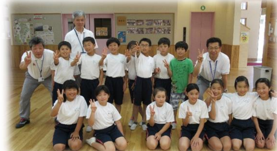
NISSAN ものづくり 6/8 (金) NISSAN 栃木工場の方を講師にお招きしてミニ自動車作りに挑戦しました。