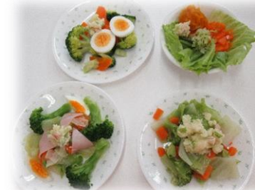
調理実習 6/12 (火) 友達と協力しておいしいサラダを作りました。ドレッシングもばっちり☆家でもトライ！！