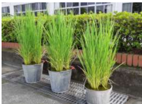
バケツ稲も、子どもたちに負けじと、すくすくと育っています(^▽^)/ (7/21 撮影)

保護者の皆様、地域の皆様、いつも本校教育にご理解・ご協力をいただきまして、誠にありがとうございます。心より感謝申し上げます。コロナの感染状況も予断を許さず、予測困難な現状が続きますが、今後とも小野寺っ子の健全な成長と安心安全のため、よろしく願い申し上げます。