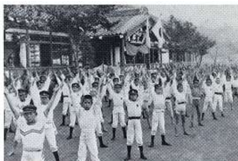
↑大正時代初期(男子)