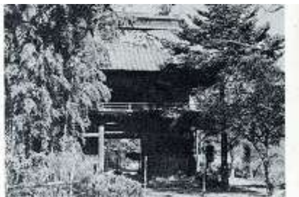
↑「在新館」の開かれた龍鏡寺(新里)