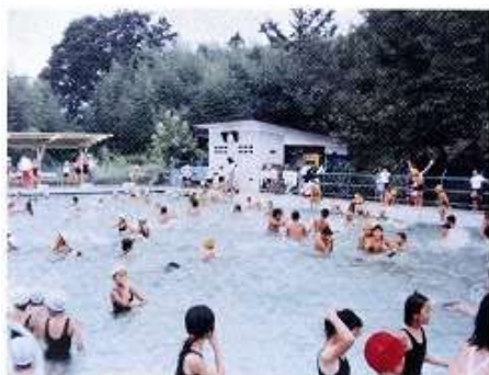
ここにも、みんなのおうちの“だれか”が映っているかも!