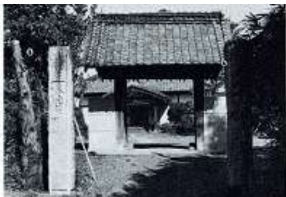
↑「聞道館」の開かれた東光院(古江)