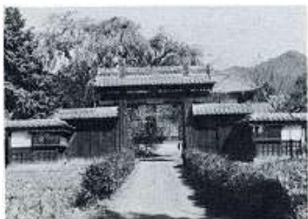
↑尋常科5・6年は、成就院(三谷)を 仮校舎としました。