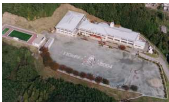
2004年「110周年記念」の航空写真