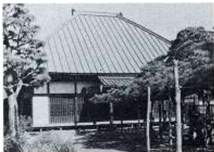
↑尋常科1・2年は、新里不動尊を 仮校舎としました。