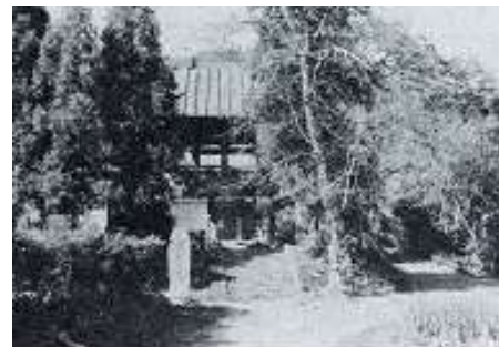
↑尋常科3・4年は、浄淋寺(古江)を 仮校舎としました。