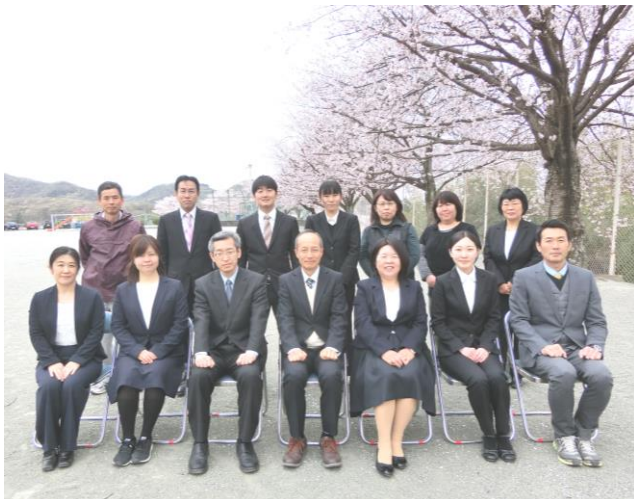
平成31年度小野寺南小学校教職員です。