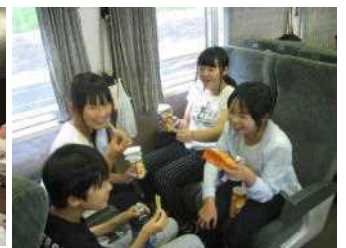
電車内でのおやつタイム