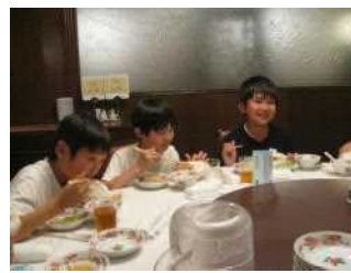
横浜中華街での夕食

この2日間で、友達との友情を更に深めるとともに、調べたことを実際に自分の目で確認し、肌で感じ、多くのことを学んだことと思います。また、天気にも恵まれ、絶景と食を楽しむことができた心に残る修学旅行になりました。