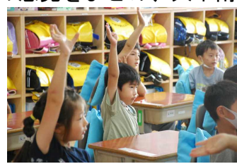
1年生も進んで発言