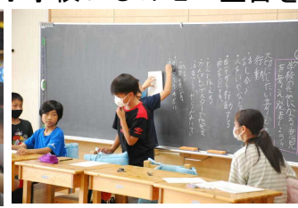
高学年は学級会で話し合い