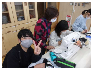
6年 トートバッグ作成 ミシンボランティア