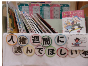
図書室の人権コーナー