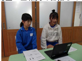
人権集会（Teamsで全学級をつなげて）