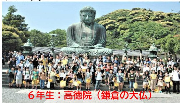
6年生：高德院（鎌倉の大仏）

鎌倉・箱根方面で実施した6年生の修学旅行、太平少年自然の家での4年宿泊学習も、参加児童全員が2日間元気に活動し、一人も体調を崩したりけがをしたりすることなく全行程を実施することができました。6年生・4年生に共通の成果は、「気持ちのよいあいさつが進んでできたこと・集団としてけじめある行動ができたこと・友達と仲良く協力できたこと・楽しい思い出ができたこと」です。子どもたちは事前学習で学んだことや毎日の学校生活で身に付けた力を大いに発揮していました。大きな成長が感じられた6年生と4年生。今後の活躍が楽しみです。