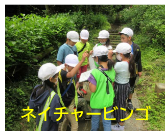
ネイチャービンゴ