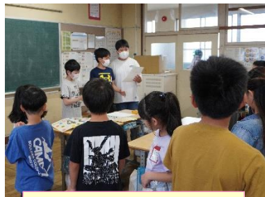
6年生がみんなをリード

入学してから2か月、1年生は楽しく学校生活を送っています。さらに、上級生のよさを感じ、安心して過ごせるように、また上級生にとっても、1年生とのかかわりを通して、互いに思いやる気持ちを育てるために、5月28日(火)に児童会主催の「1年生を迎える会」を行いました。4月の代表委員会での話合いの段階から、みんなで作り上げようという意識の高まりが見られました。