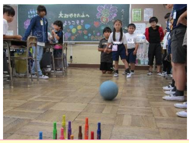
ボーリングゲームで盛り上がり