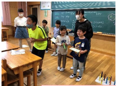
飛び出すカードのプレゼントに大喜び