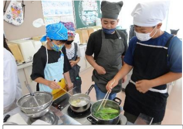
5・6年生:家庭科調理実習

明治6年に本校の前身として開校された「象成学舎」の名にちなみ、学校だよりの題字を「象成」(しょうせい)としました。