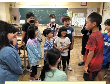
カードを引いて自己紹介