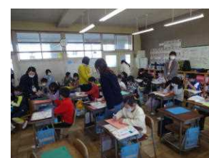
【カッター学習支援】