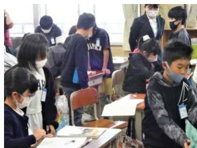
【ごみのゆくえを話し合う】