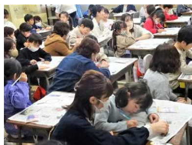
【アサガオの種を観察】

授業参観では、徒歩・自転車での来校等をお願いしたところ、雨天にもかかわらずご理解とご協力をいただきありがとうございました。 どのクラスの児童も、緊張しながらも生き生きとした態度で、授業に臨んでいる様子をご覧いただけたと思います。