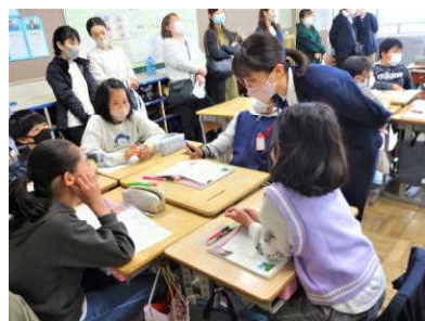
【春らしい言葉を俳句に】