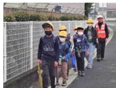
【1年生のペースで登校】

1年生にとっては、毎日が初めてのことであり、興味津々の毎日です。保護者の皆様、地域の方々に見守られての登下校や上級生から学校生活の基本を教えてもらいながら、皆元気な笑顔を見せて小学校生活を楽しんでいます。