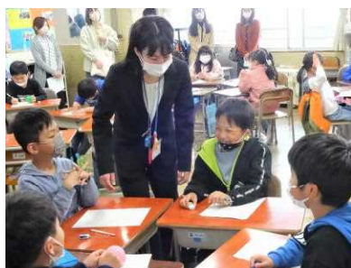
【お互いのことを知ろう】