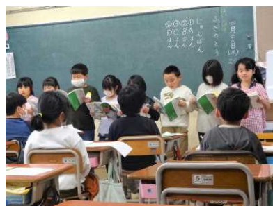
【グループごとに音読発表】