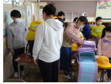
【6年生が朝のお手伝い】