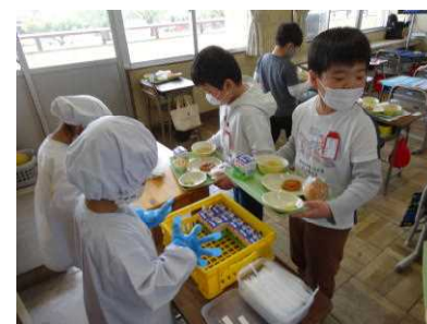
【自分たちで給食の準備】