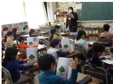
【授業参観の様子：1年生】

明治6年12月に本校の前身として開校された『象成學舎』の名にちなみ、学校だよりの題字を象成（しょうせい）としました。