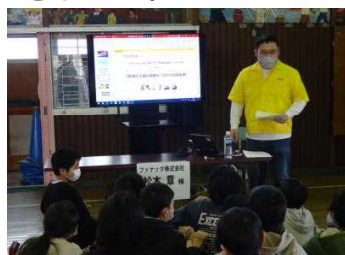
【ロボット開発の仕事】