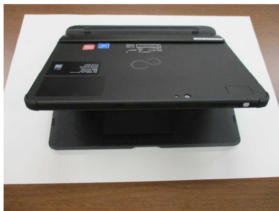
②ディスプレイを開きます。