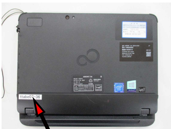
①タブレット上面図