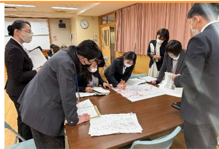
授業研究会 グループ協議の様子