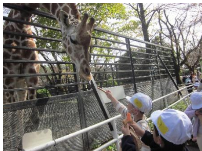
1年生:宇都宮動物園…11/11(火)