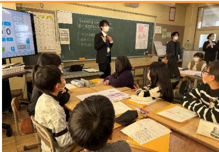
5年3組 総合的な学習の時間「わたしたちの地球」