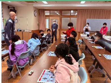
5年生:日産モノづくりキャラバン…11/25・26