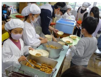
【自分たちで給食の準備】