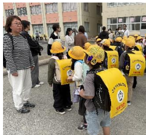
【方面別下校・お迎え当番】