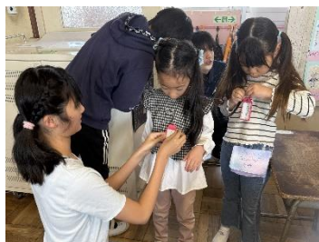
【6年生が朝の手伝い】

1年生にとっては、初めてのことばかりで、興味津々の毎日です。保護者の皆様、地域の皆様に見守られての登下校や、上級生から学校生活の基本を教わりながら、みんな元気な笑顔を見せて小学校生活を楽しんでいます。