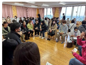
学年委員選出・学年懇談会の様子