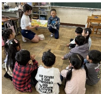
6年生が1年生に 朝の読み聞かせ

新年度になり、早1か月が過ぎました。校庭の木々は、桃色の桜の花から目に柔らかな若葉の時季を迎えています。