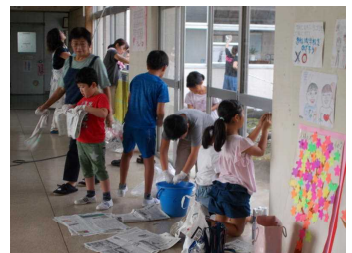
▲学校中がきれいになりました！