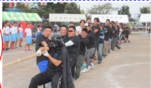
おやじの会の皆様と 3・4年の綱引き対決