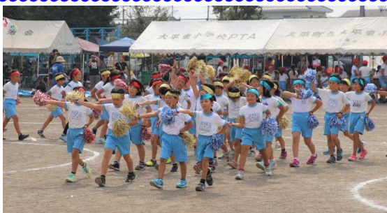
3・4年 ゆずの曲「タッタ」でさわやかに!