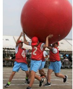
5・6年 白熱の騎馬戦・迫力の「東小ソーラン」・全校生による大玉送りラストスパート!