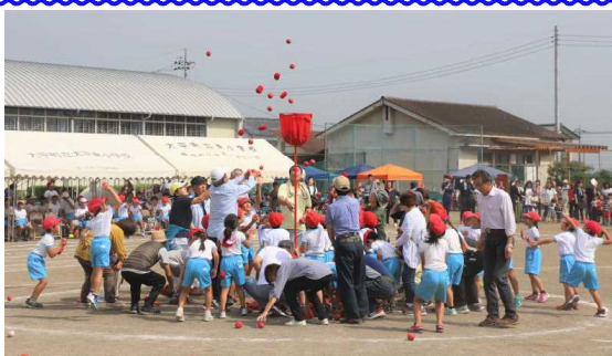
おじいちゃんやおばあちゃんと いっしょに玉入れ! 楽しかったです。

9月28日(土) 秋季大運動会が、多くのご来賓の方々のご臨席のもと、盛大に開催されました。天気にも恵まれ、子どもたちは、運動会スローガン「一致団結 力を合わせ 思い出に残る 運動会」の言葉そのままに、練習の成果を十分に発揮してくれました。特に、小学校最後の運動会となる6年生は、「泣けるくらい感動できる運動会にしたい」というめあてを立てて、演技に係活動に大いに活躍しました。子どもたちが精一杯に力を出している姿や、友達とともに心から喜び合っている姿を目にして、大いに感動しました。保護者の皆様、おやじの会の皆様、地域の皆様には、運動会の準備、応援、後片付け等にご協力いただき本当にありがとうございました。心より御礼申し上げます。