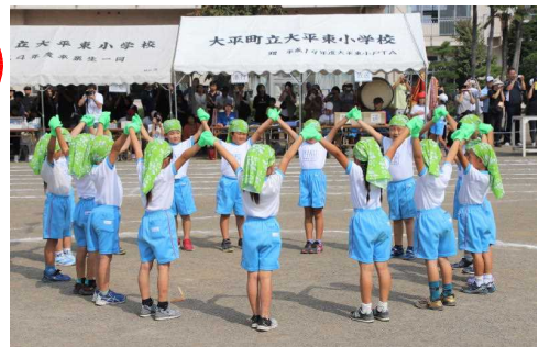
1・2年 「パブリカ」の曲によって