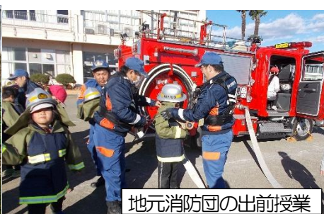
地元消防団の出前授業