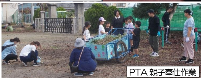
P T A親子奉仕作業

校庭・敷地内の除草作業を親子で行いました。学校だけでは対処しきれない場所もきれいになりました。親子でこのように学校や地域の奉仕作業を行うという大変意義のある貴重な機会となりました。