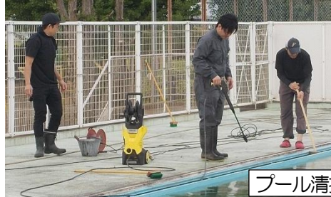
プール清掃の事前準備作業

4月にプール清掃の事前準備作業を行いました。児童では大変な作業（側溝の泥をきれいにする作業等）を、事前準備作業として行いました。今年度も、おやじの会の方々が協力してくださいました。おかげで短時間で終わることができました。