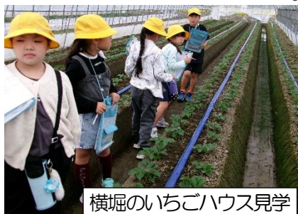
横堀のいちごハウス見学

4年生は総合的な学習の時間に「福祉」について学習しています。地域の点字ボランティアの方にお越しいただき、点字体験を行いました。点字板で一人一人点字を作成しました。分からない