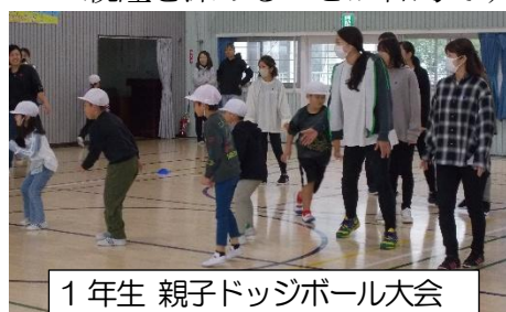
1年生 親子ドッジボール大会

親子ふれあい集会はP T A学年部の方が、計画・準備・進行して行われます。親子のふれあい、親同士の親睦を深めることが目的です。