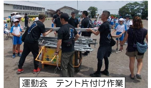
運動会 テント片付け作業

PTA親子奉仕作業に合わせて、楽しいイベントを開催してくださいました。今年は、わたあめ販売を行いました。わたあめ機で3色のわたあめを作り、家庭科室前で販売しました。行列ができるほどの盛況で、完売しました。体育館ではドッジボール大会を行いました。