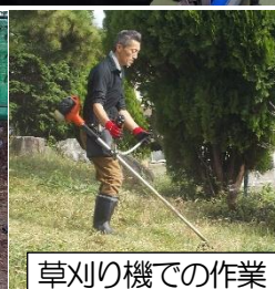
草刈り機での作業