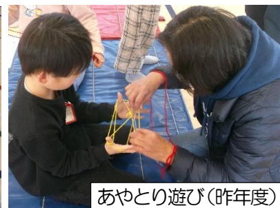
あやとり遊び(昨年度)