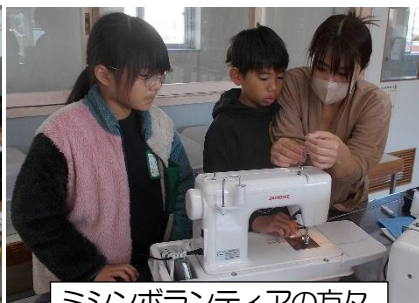
ミシンボランティアの方々

6年生は伝統文化体験として生け花体験授業を行いました。3名の学校ボランティアの方に教えてもらいながら、それぞれ試行錯誤し、花の種類や色を楽しみながら生けていました。