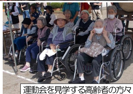
運動会を見学する高齢者の方々