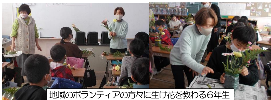
地域のボランティアの方々に生け花を教わる6年生

6年生は伝統文化体験として生け花体験授業を行いました。3名の学校ボランティアの方に教えてもらいながら、それぞれ試行錯誤し、花の種類や色を楽しみながら生けていました。