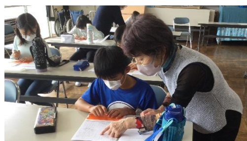
点字ボランティアの方々に教わる4年生