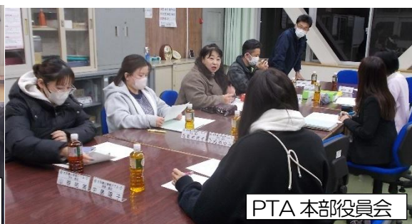
P T A本部役員会