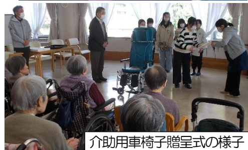
介助用車椅子贈呈式の様子