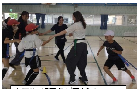
4年生 親子タグラグビー