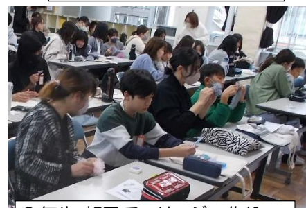
6年生 親子でコサージュ作り