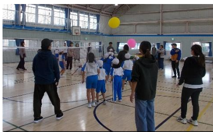
2年生 親子ふうせんバレーボール