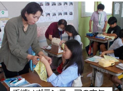
手縫いボランティアの方々