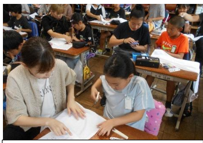
5年生 親子で手ぬいの雑巾づくり