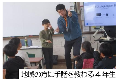
地域の方に手話を教わる4年生

5年生は家庭科で初めて手縫いやミシンの学習をします。手縫いやミシンの授業では、学校ボランティアの方々にお手伝いいただき