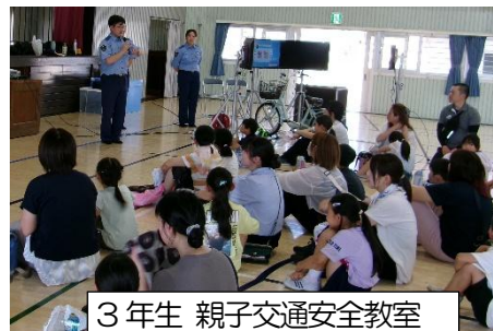
3年生 親子交通安全教室