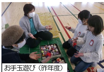
お手玉遊び(昨年度)

1年生は生活科「むかしから つたわる あそびを たのしもう」で、地域の人に、昔から伝わる遊びを教わったり、一緒に遊んだりする活動を行います。昔遊びを通して、地域の人と触れ合うことの大切さを学びます。今年度も1月末に予定されています。