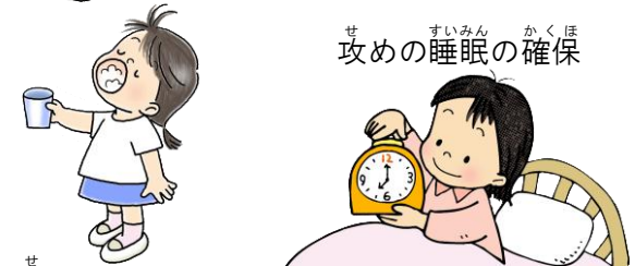
せめ の うが い 攻めのうがい

にし か た し ょ う ぼ け ん し つ 西方小 保健室 が っ き は し 3学期が始まってから、インフルエンザが流行して、2月になっても治 まらず、流行が長引きそうな気配です。 けんこうりよく 攻めのマスク