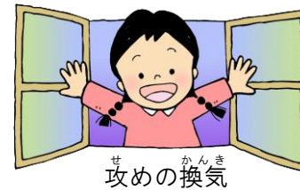
せめ かんき 攻めの換気

せめ せき エチケット ⇒ せめ てあら い 攻めの咳エチケット ⇒ 攻めの手洗い