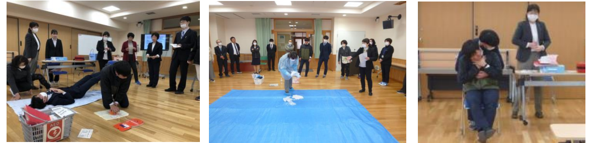
アナフィラキシー発症時の対応

各小中学校では、児童生徒が安全な学校生活を送るために、教職員がアレルギー、感染症、窒息等に関する研修会を実施しています。大平中学校で実施した様子を写真でご紹介します。